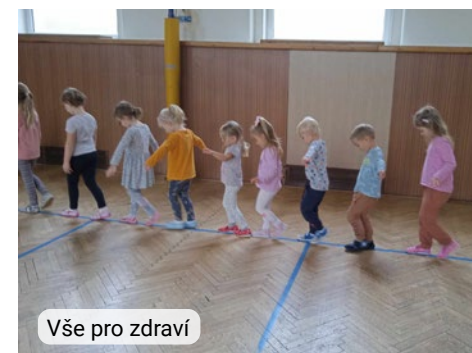
Vše pro zdraví