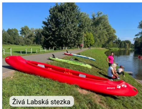
Živá Labská stezka