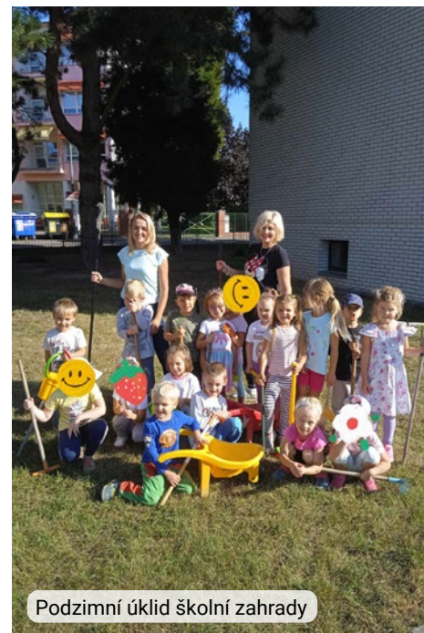
Podzimní úklid školní zahrady