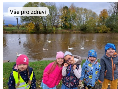
Vše pro zdraví