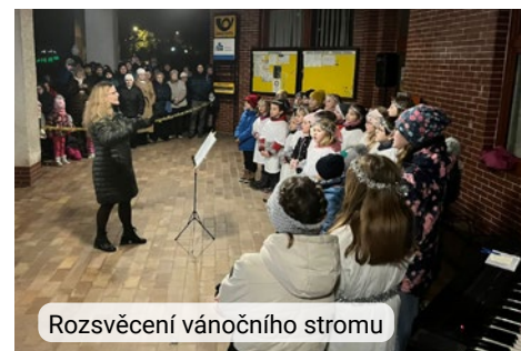
Rozsvěcení vánočního stromu