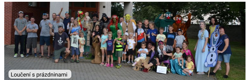
Loučení s prázdninami