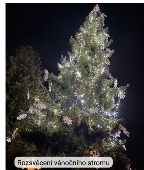
Rozsvěcení vánočního stromu