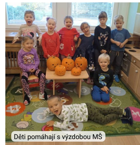
Děti pomáhají s výzdobou MŠ