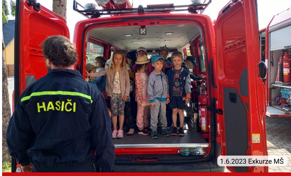
1.6.2023 Exkurze MŠ