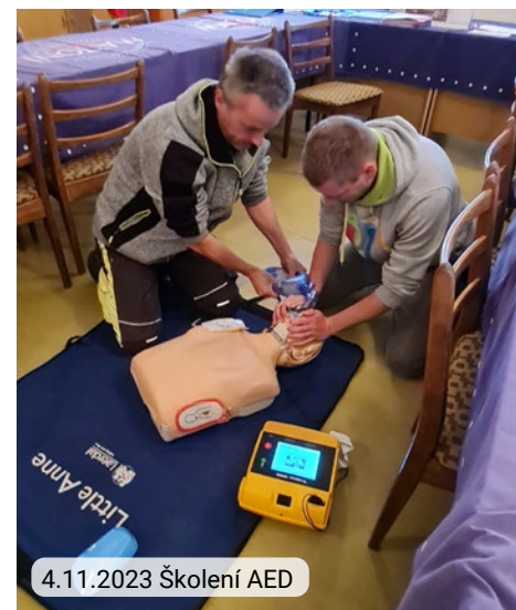
4.11.2023 Školení AED