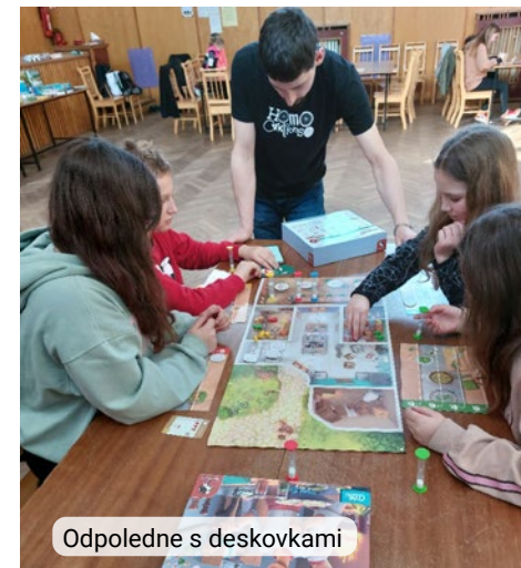
Odpoledne s deskovkami