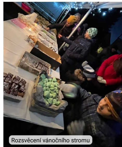
Rozsvěcení vánočního stromu