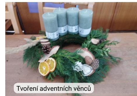
Tvoření adventních věnců