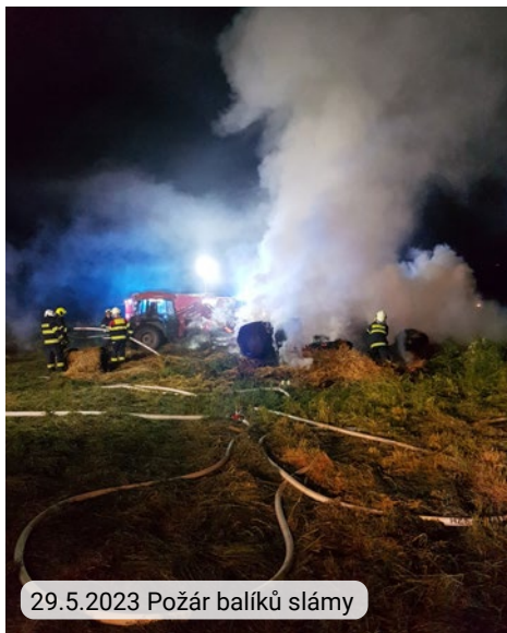
29.5.2023 Požár balíků slámy

Nechyběli jsme také na mnoha společenských akcích v naší obci. Ve spolupráci s kulturní komisí jsme se podíleli například na Dětském dni, Pálení čarodějnic, Sportovním dni i na akci Živá labská stezka. Samozřejmostí byla také exkurze základní a mateřské školy v hasičské zbrojnici na konci loňského školního roku.