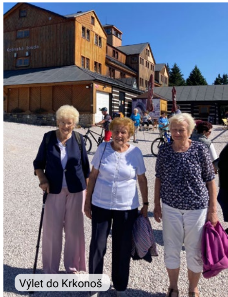
Výlet do Krkonoš